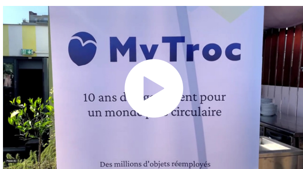
Clients, partenaires et collaborateurs décrivent MyTroc Pro en trois mots : impact, écoute et bienveillance.

En 2025, MyTroc célèbre dix années d'impact et d'engagement pour une économie plus circulaire. Née avec 2 000 euros et une idée claire, la startup est devenue une référence du réemploi digital pour les grands groupes, prouvant qu'on peut concilier écologie et performance économique.